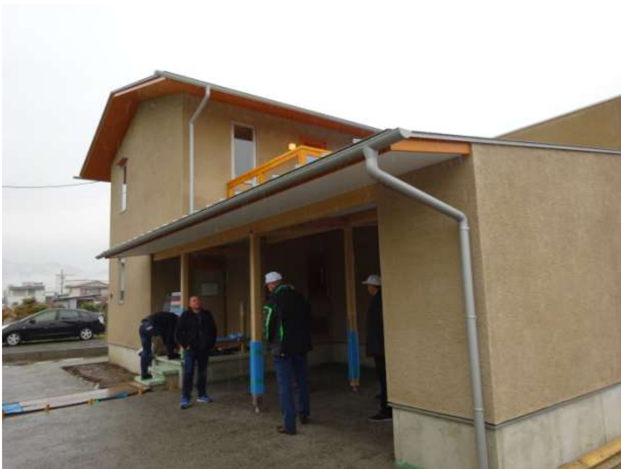
- посещение строящихся индивидуальных домов из FRпанелей