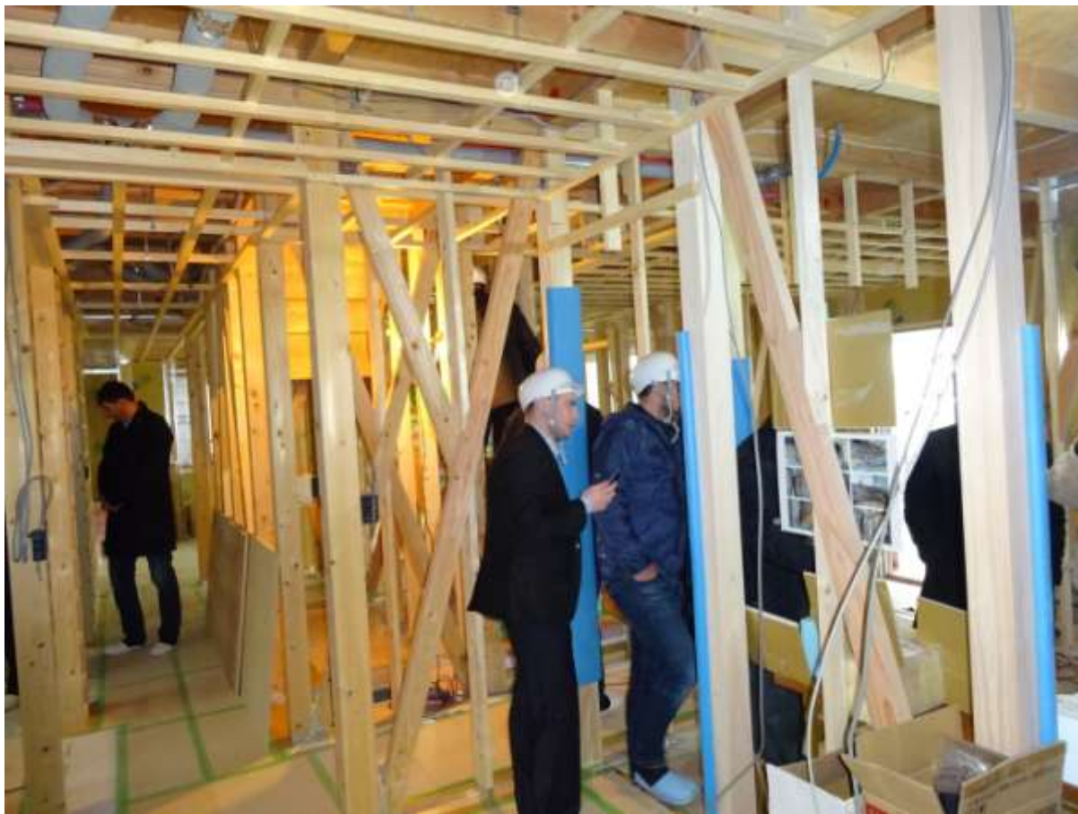
- посещение строящихся индивидуальных домов из FRпанелей