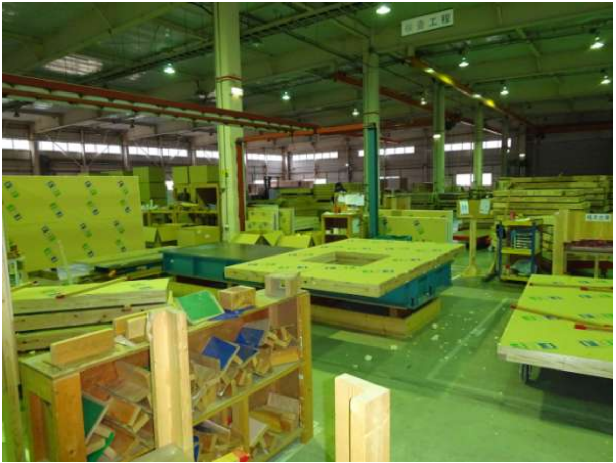
Посещение завода по производству FRпанелей