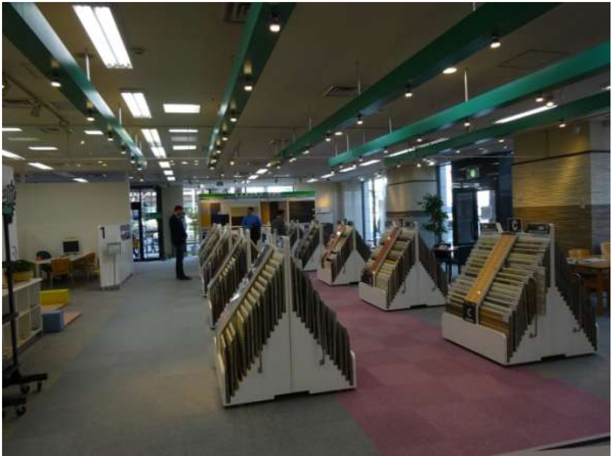
г. Нагоя – выставочный центр компании Нитиха