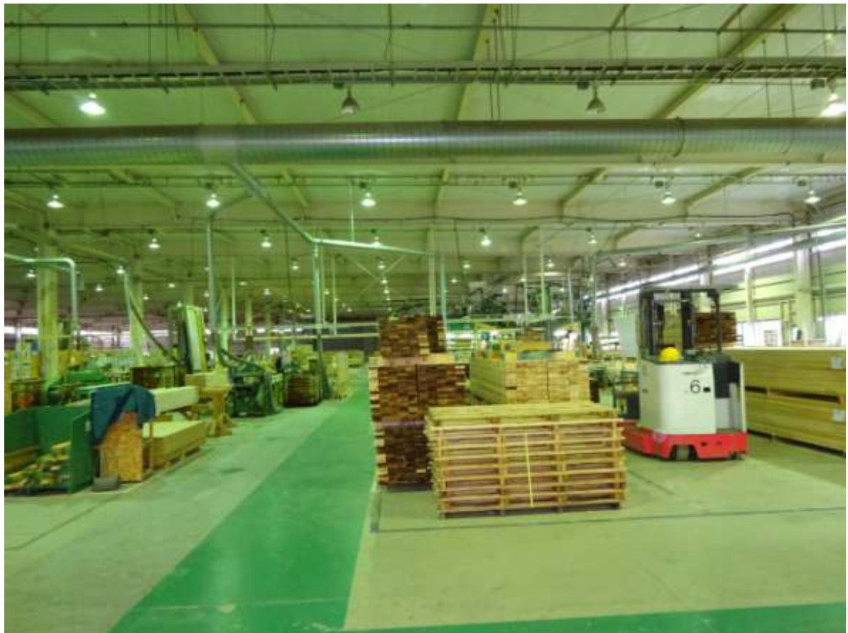
Посещение завода по производству FRпанелей